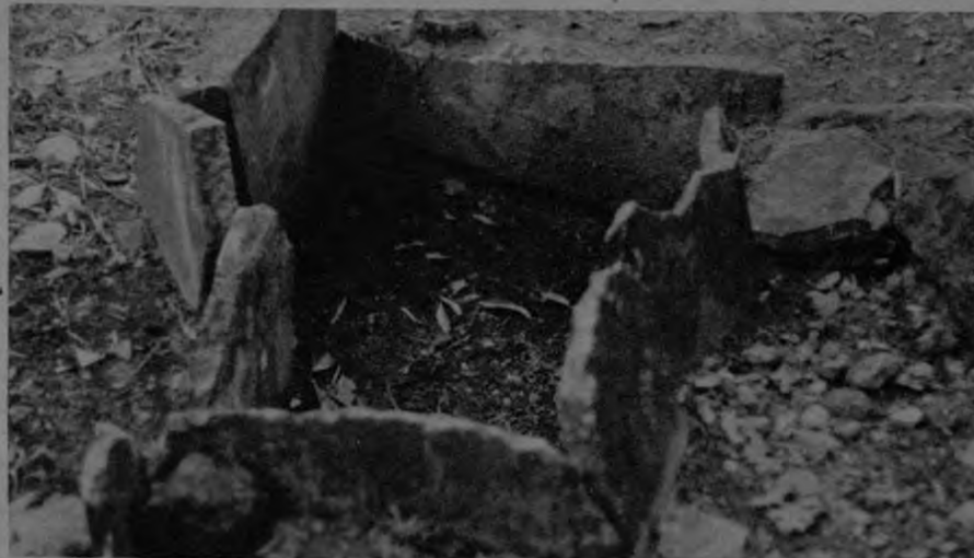
La fotografía ofrece aspectos ilustrativos en cuanto a la forma de como se construían las tumbas o sepulturas, por los indígenas ubicados en Guayabo de Turrialba. Como se aprecia eran de muy sencilla construcción.

Latitud Norte 9° 58' 22" Longitud Oeste 83° 41' 20" Geográficamente, el Monumento Guayabo se encuentra ubicado en la Vertiente Atlántica, a 19 Kms al noroeste de la ciudad de Turrialba y a 64 Kms al este de San José.