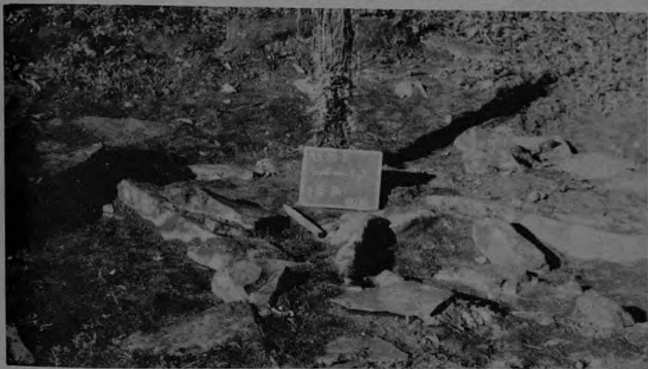
La gráfica presenta otra modalidad de sepulturas indígenas, las mismas se orientaban de norte a sur.

Estados Unidos no es el único país que trata de mejorar su dieta. En Europa y Canadá son concientes del daño de una dieta impropia y trabajan en nuevos objetivos dietéticos. Paralelamente a esto, no es sorpresa el auge que están tomando los restaurantes y comidas japonesas en el mundo.